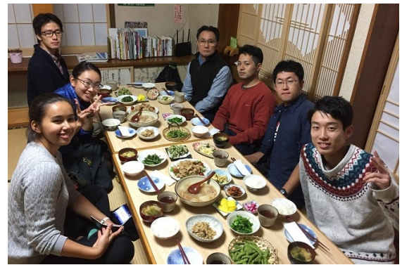
写真1 11月23日夜。農家民宿・いちばん星で、晩ごはんを囲む東京海洋大学チーム。

今回参加した東京海洋大学大学院生・学部生は6名、うち4名は2018年2月に開催したワークショップ「鹿島の海と魚を語ろう」にも参加しているので、二度目の南相馬訪問になります。また、うち5名は、2018年11月初めの東京海洋大学「海鷹祭」で催した「福島海@東京海洋大学プロジェクト2018 福島の美味しい魚について漁師さんたちと話そう」にもスタッフとして参加しています。これらの学生6名に教員2名を加えた総勢8名で南相馬を訪問しました。