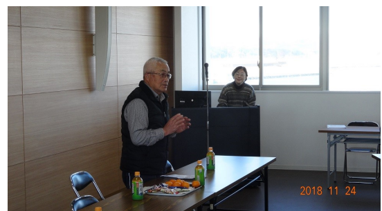
写真7 松野相双漁協鹿島支所代表から開会のご挨拶をいただきました。