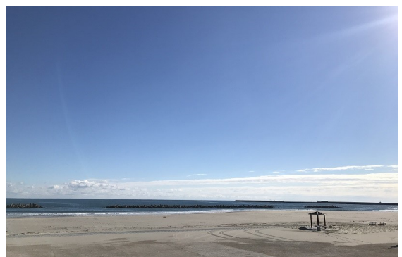
写真6 真野川漁港から歩き、少し高さのある丘を登ると見晴らしのいい烏崎海浜公園に出ます。