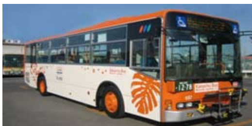
自転車ラックバスの一部は特別カラー車両で運行します。